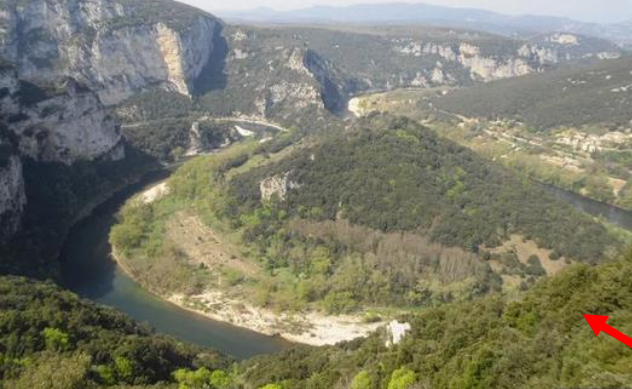
Massif central, montagne