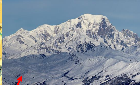
Mont Blanc 4809 m