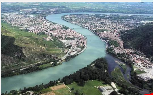
Vallée du fleuve Rhone