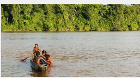
Fleuve St Laurent du Maroni