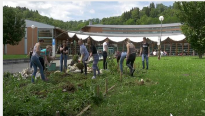
Des éco-délégués côté Grenoble ...

- croiser les approches inter culturelles (qu'elles soient locales, régionales etc.)