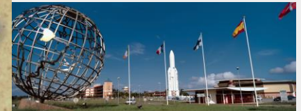
Kourou, centre spatial