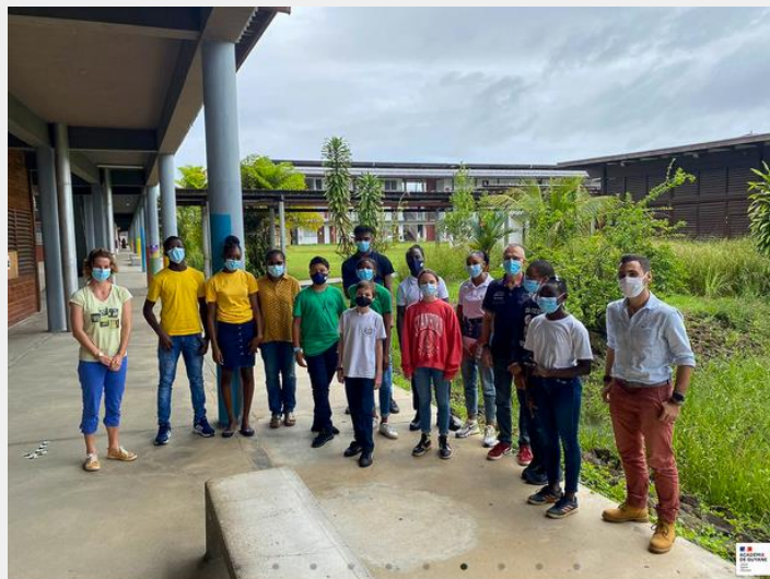
Des éco-délégués côté Guyane ...

- définir ensemble un objet d'étude dont la production finale sera commune (collaborative ou de même format);